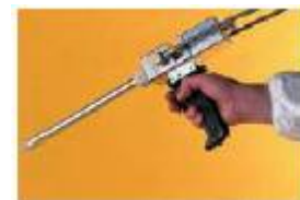
Προαιρετικό πιστόλι χειρός

Λειτουργεί με πεπιεσμένο αέρα. Ρευστότητες υλικών: Μέχρι 500.000 cps Μέγεθος δόσης: Από 0,5 ml μέχρι 50ml Ταχύτητα εφαρμογής: Μέχρι 30 δόσεις το λεπτό Ανάμιξη: Αναλώσιμο στατικό ρύγχος ανάμιξης Μέγεθος δοχείων: 2,5 Lt Υλικά εφαρμογής: Εποξειδικά, Πολυουρεθανικά, Μεθακρυλικά, Σιλικόνη Χώρα κατασκευής: Αγγλία